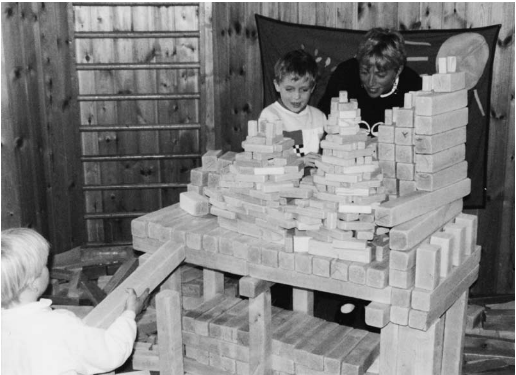
Her er bilde av bygging med Yvi-klossar.

Utover i etterkrigstida blir etter kvart kvardagen i barnehagen tilmåta meir moderne pedagogiske prinsipp. Det blir gjort større plass for den frie leiken – ein leik der barna sjølve skal få utfalde seg med fantasi og kreativitet. Leiketøyet var enkelt og «heimgjort» – det var t.d. importforbod for leiker i mange år etter den andre verdskrigen. Utover i 1950- og 60-åra, ja, til langt ut i 1970-åra skulle det vera såkalla «riktige leiker», slik som mange foreldre òg prøva å gje barna sine i heimen. I Trondheim var dei såkalla YVI-klossane populære. Det var byggeklossar av tre i varierte lengder. Med kryssfinerdyr kunne ein få seg buskap og laga bondegardar. Også bilane og toga var av tre! Den store mengda av billege, og ikkje alltid så pedagogiske plastleiker kom først for alvor ut i 1960-åra, og i mange barnehagar var dei ikkje særleg velkomne.