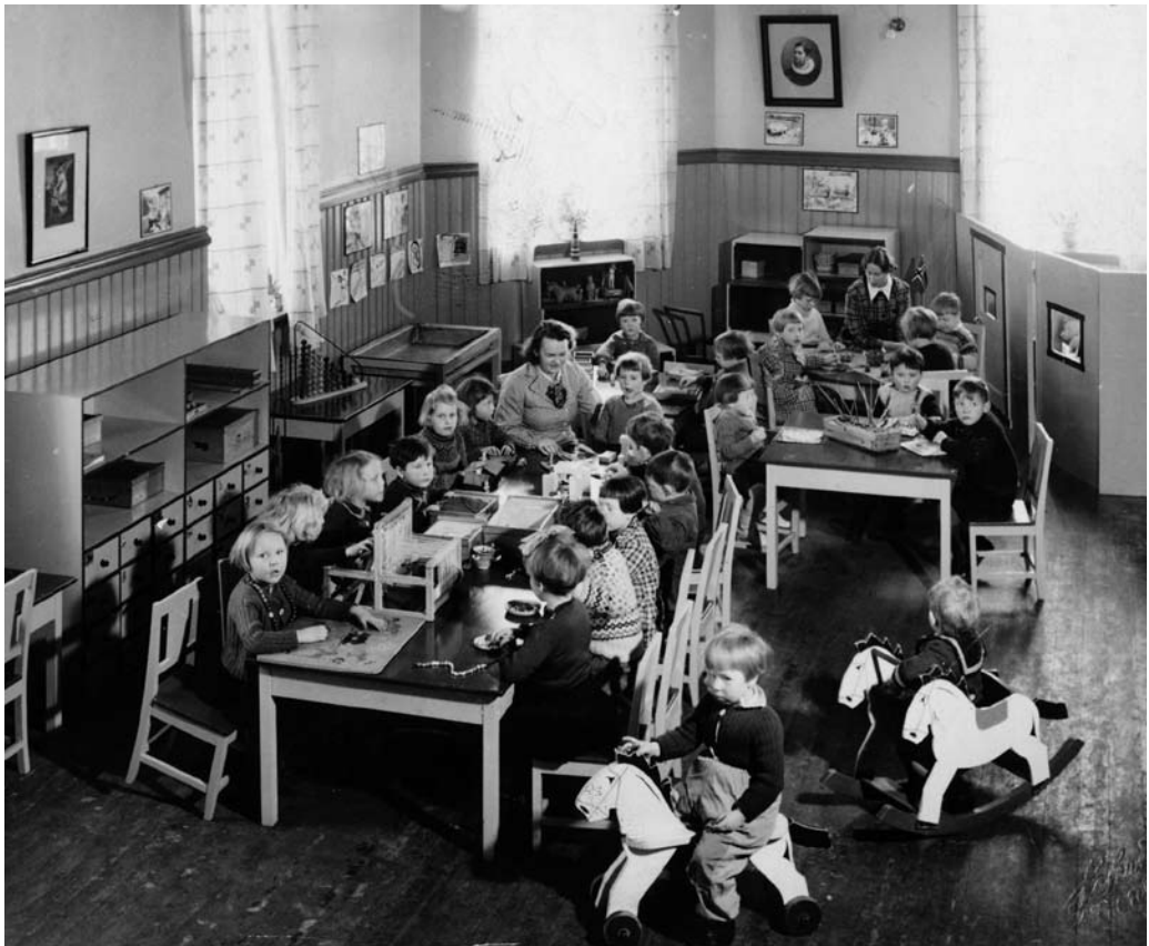
Leik og læring i Bakklandet barnehage 1932