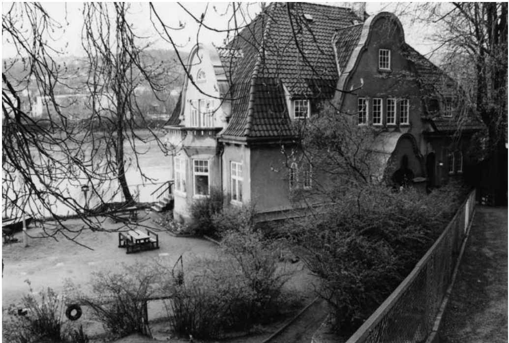
Midtbyen barnehage i Elvegt.1 B som barnehagen overtok i 1968. Bildet er fra jubileumsåret 1987.

Det ble bestemt at barnehagen skulle rives og 5. november 1968 var det innvielse av «ny» barnehage i Elvegaten 1B, etter ett års renovering. Bygningen i Elvegaten har mange estetiske kvaliteter. Det er et vakkert hus med store utearealer som er avskjermet fra trafikk og støy, med Nidelven som nærmeste nabo og store vakre trær. Det er et mål for